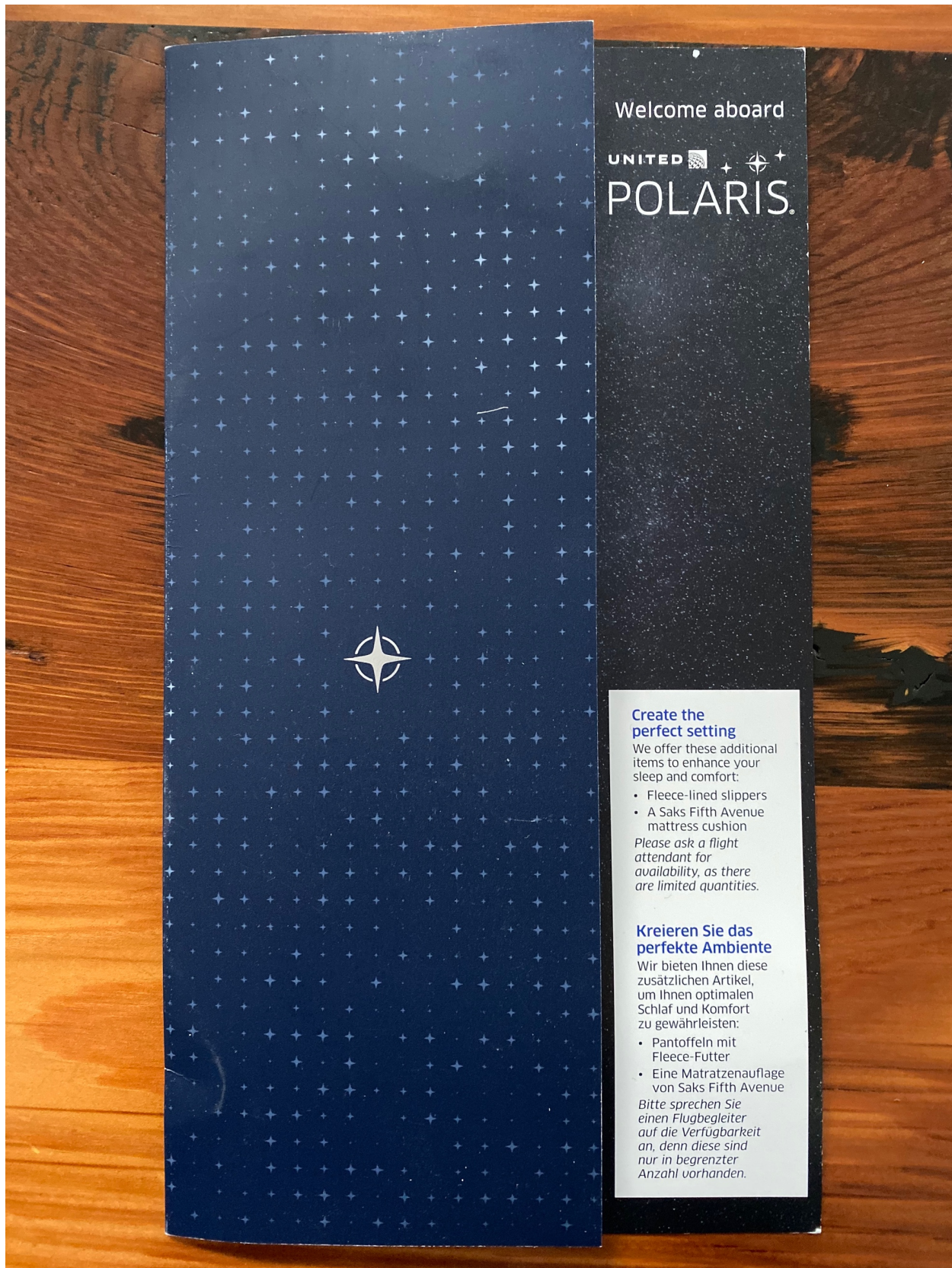
United Airlines Menu from UA960